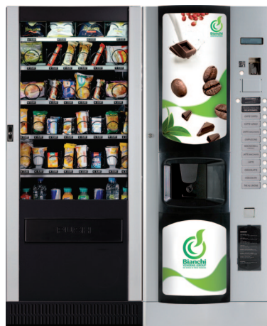
LEI 400 & BVM 676